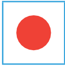
Made in Japan